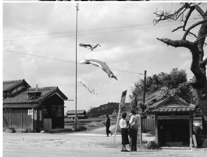
上：今辻子交差点付近 奈良電気鉄道・奈良発京都行特急 昭和33年