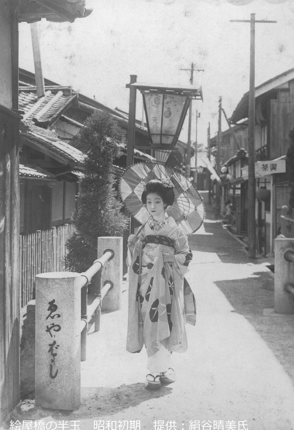
絵屋橋の半玉 昭和初期