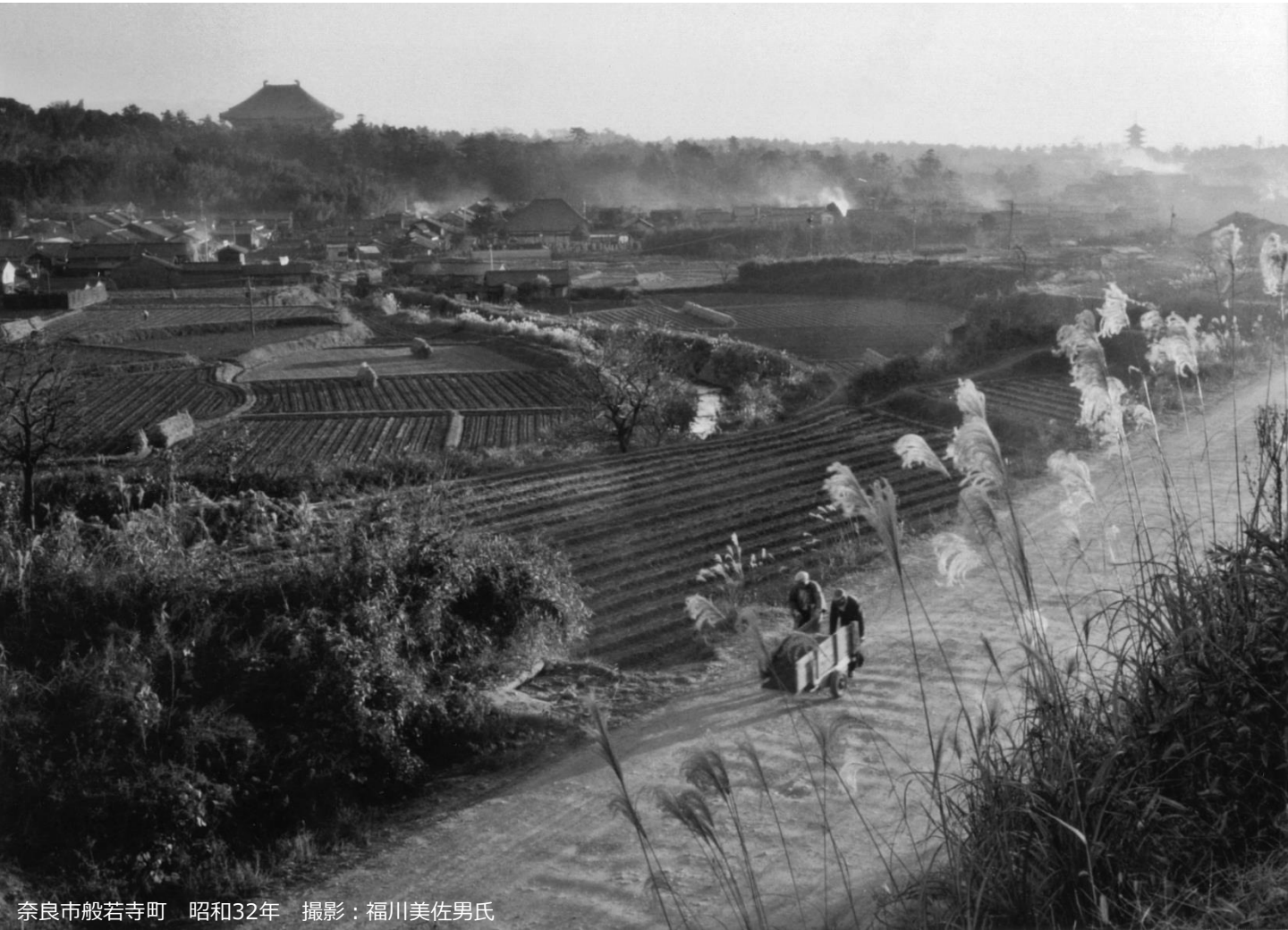
奈良市般若寺町 昭和32年